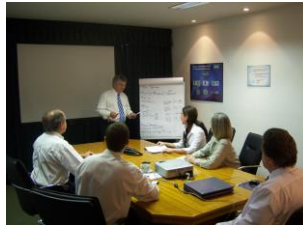
Grupo de procesos de Seguimiento y Control

Validar el alcance incluye revisar los entregables con el cliente o el patrocinador para asegurarse de que se han completado satisfactoriamente y para obtener de ellos su aceptación formal.