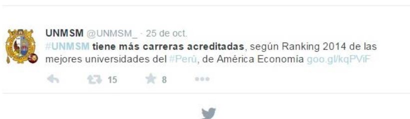
Figura 1: Tuit de promoción por parte de la institución

Twitter es utilizado por las universidades peruanas para compartir y comunicar noticias e información de diverso índole, también es empleado para difundir campañas promocionales vinculadas a la capacidad de consolidación territorial de algunas universidades, publicitar su oferta formativa, competitividad, captación de estudiantes, o para divulgar su programación cultural y temas relacionados con los servicios que ofrecen (Guzmán, Del Moral, Ladrón y Gil, 2013). En la Figura 1 se ejemplifica la reflexión anterior y se muestra cómo una de las universidades de la muestra plantea un anuncio promocional destacando una ventaja académica diferenciadora sobre el resto de sus competidores cercanos.