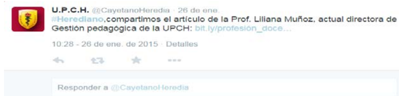
Figura 7: Difusión de investigaciones

herramienta atractiva para la difusión del conocimiento. Solberg, Ronne y Jensen (2008) afirman que cuando se busca información o conocimiento, también se busca la interacción, por lo que la plataforma de microblog será útil para este tipo de propósito. Un ejemplo puede ser la difusión directa de los artículos elaborados por los profesores de la institución, como se aprecia en la Figura 7.