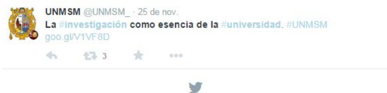
Figura 6: Transmisión del saber

ha convertido en la mejor estrategia para la transmisión del saber. Uno de los rasgos que fundamentan la existencia de las universidades es la difusión del conocimiento; es en este contexto que Twitter surge como una herramienta ejemplar para compartir las investigaciones realizadas por estas instituciones como se aprecia en la Figura 6. De acuerdo a esa función, la institución construye una acreditación para su reputación, cuando los usuarios relacionan ese tipo de contenidos con la calidad universitaria.