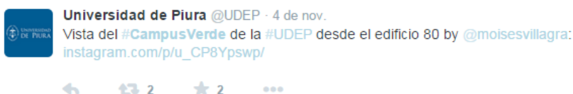
Figura 5: Hashtag que identifica una institución

también pueden servir como invitación para compartir espacios. Es por ellos que algunas universidades impulsan su imagen a través de espacios relacionados o hacen alusión a su nombre. En la Figura 5 la Universidad de Piura hace alusión a la reflexión anterior y muestra un tweet relacionado a la etiqueta #CampusVerde con la que se asocia. De alguna manera esa etiqueta se convierte en registro que enumera diversos mensajes que hagan alguna mención a dicha universidad.