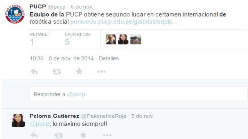
Figura 3: Tuit que promueve reconocimiento e importancia

reconocimiento e importancia que tienen las instituciones (Figura 3). El prestigio y reputación de cada institución son elementos que hacen a las universidades atractivas para ser seguidas por sus stakeholders . Pardo (2005) resalta la importancia de estos dos elementos y destaca que ambos deben protegerse y generarse desde todas las herramientas posibles, siendo la comunicación reputacional uno de sus pilares por ser el rostro de cada institución.