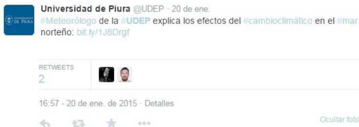
Figura 8: Publicación de investigaciones

mensajes. Por ello se podría afirmar que Twitter puede adoptar la forma de una bitácora de conocimiento, donde estarán almacenados una cantidad de tuits acerca de diversos temas o investigaciones que han sido compartidas manera digital. Así se aprecia en la Figura 8 donde se difunde contenido de una investigación y se utiliza a la vez varios hashtags .