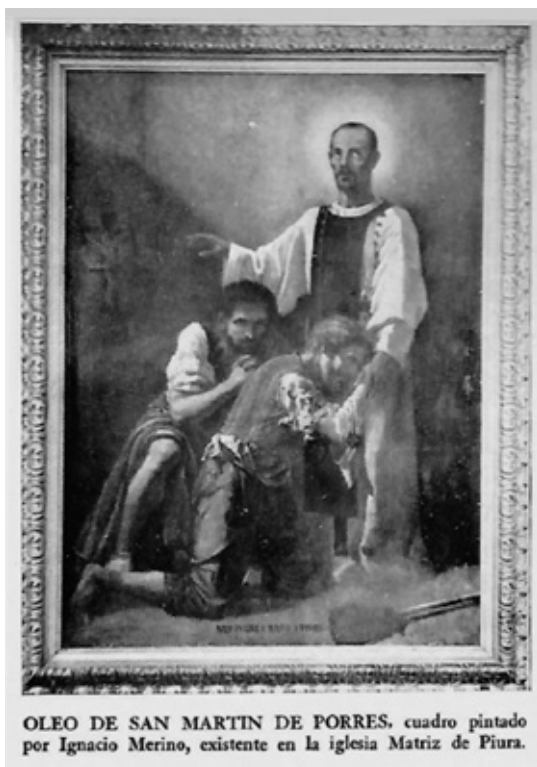
Figura n.º 4 Fotografía del óleo San Martín de Porres.