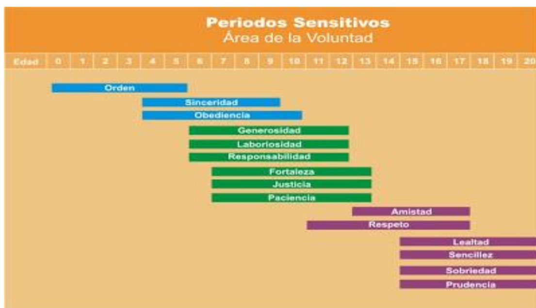
Figura 1. Periodos sensitivos. Área de la voluntad

Esta figura muestra los periodos sensitivos y las virtudes.