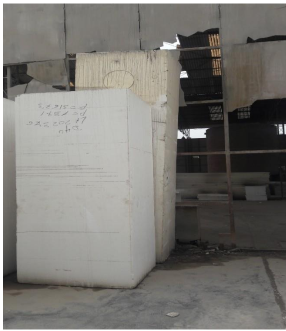
“Zona de merma de Inpol S.A.C.”