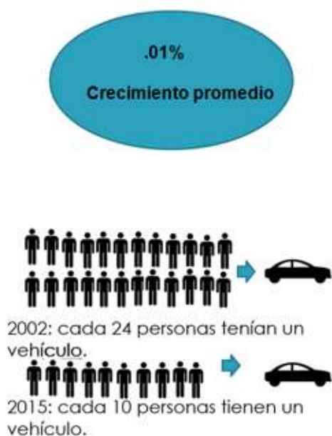
Figura 2. Crecimiento promedio en Perú