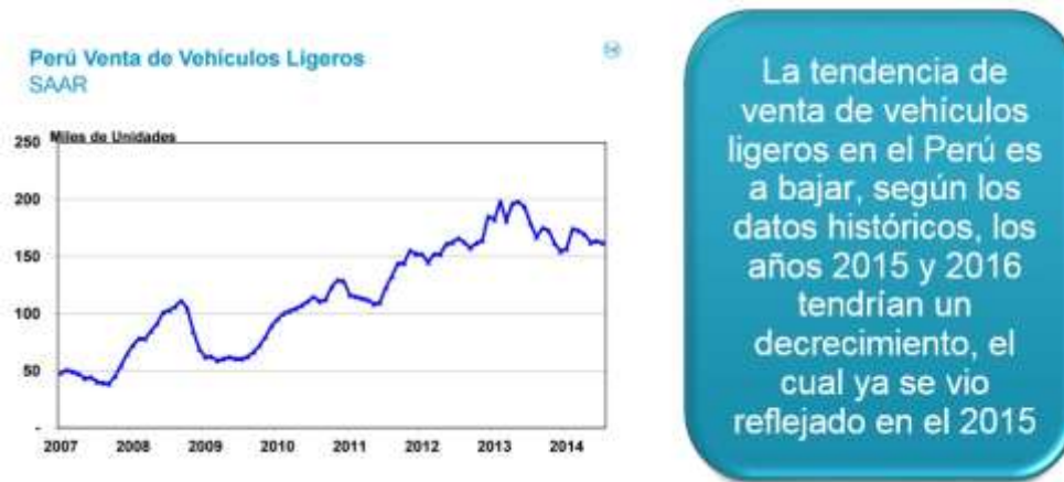
Figura 4. Venta de vehículos ligeros en Perú