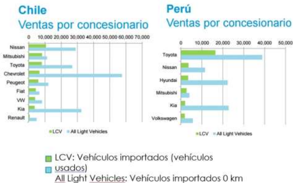
Figura 3. Ventas por concesionario en Chile y Perú