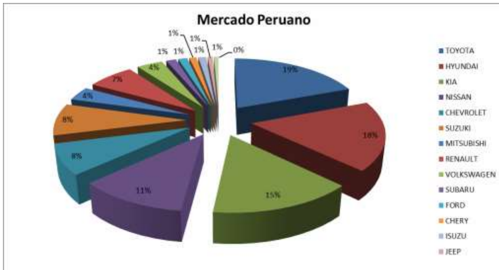
Figura 5. Parque automotor peruano