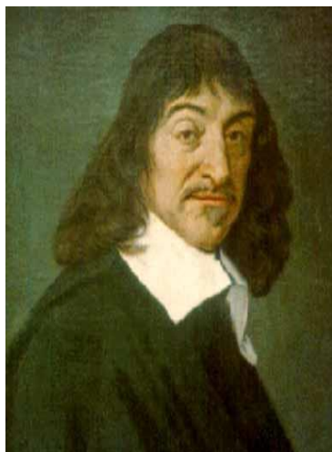
René Descartes (1596-1650)