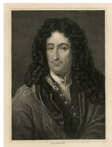
Gottfried von Leibniz (1.646 – 1.716)

“Los números imaginarios son un excelente y maravilloso refugio del Espíritu Santo, una especie de anfibio entre ser y no ser”