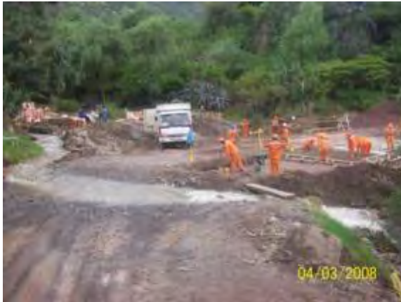
Foto 3.25 Control de niveles topográficos