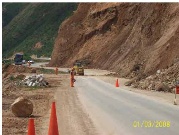
Foto 2.28 Limpieza de derrumbes con equipo