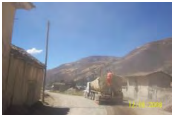
Foto 3.13 Riego de plataforma

En la fotos 3.14 se puede apreciar la plataforma con el aporte de material concluido y en la foto 3.15 se ve que la geometría de la carretera la cual no ha sido variada.