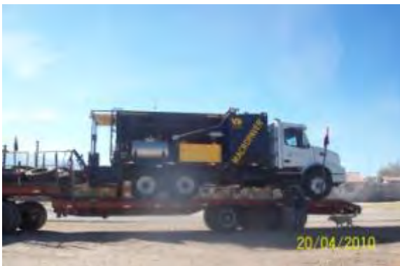
Foto 3.35 Abastecimiento de Macropaver