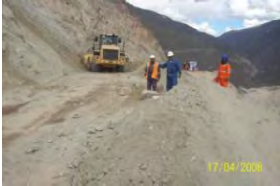
Foto 2.53 Cargador en pleno trabajo