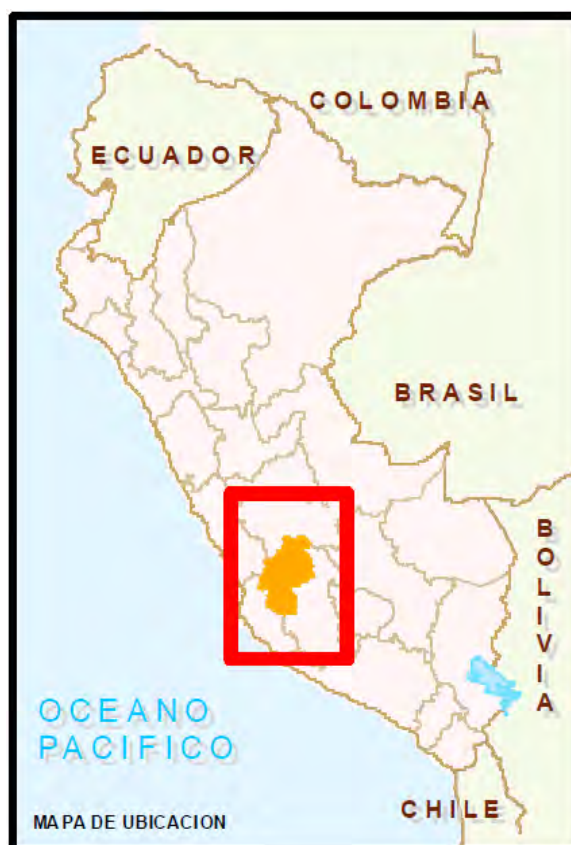
Figura 1.1 Ubicación de los departamentos del Perú que forman parte del proyecto.