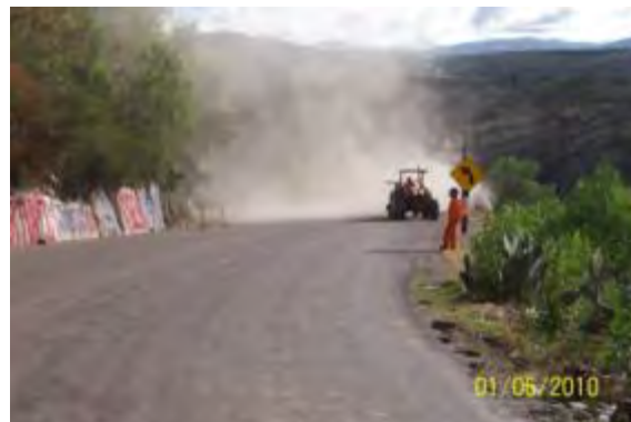
Foto 3.38 Limpieza previa a la colocación de la lechada asfáltica

Se inicia la aplicación de la lechada como se ve en la foto 3.39 en la siguiente foto ya puede apreciar un sector que se ha realizado la aplicación de la lechada un solo carril en la foto 3.40, se ve la pasada de manta para mejorar el acabado.