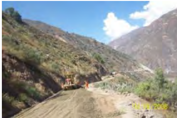
Foto 3.10 Conformación con motoniveladora

Para realizar estas actividades se requiere una supervisión constante de las labores de batido y conformación de la capa de material como se aprecia en la foto 3.11