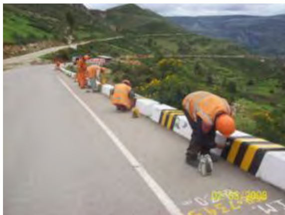
Foto 2.26 Pintado de Muros

En la foto 2.26 se aprecia las labores de mantenimiento de los muros que son repintados.