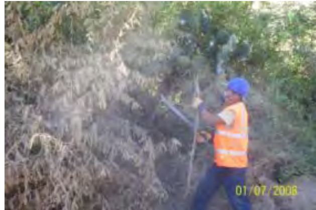
Foto 2.29 Trabajos de Roce Manual