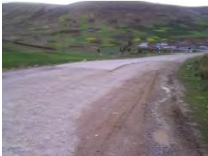
Foto 1.6 Inicio del tramo a nivel de afirmado Imperial Pampas Mayocc

Los centros poblados que se encuentran en el ámbito del tramo son Pampas, Rundo, Marcapata, San Francisco de Checche, Matachocco, Lechuguillas, Tucuccassa, Vista Florida, Chonta, Tullpacancha, Churcampa, Pichcay y San Miguel de Mayocc. Este tramo tiene una superficie de rodadura a nivel de afirmado, la calzada tiene un solo carril, y se tiene una plataforma de un ancho útil muy variable que van desde los 4.00 a 8.80 m. Los tipos de daños que se presentan en dicho tramo son deformaciones (ahuellamientos), encalaminados, huecos, erosiones, cruce de agua. Estos daños se presentan en diferentes niveles de severidad.