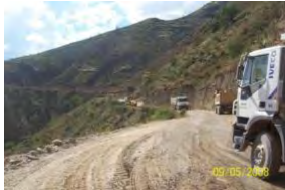
Foto 3.7 Transporte de material

Luego de ser transportado el material en volquetes llega al sector de la carretera para realizar la descarga como se ve en la foto 3.8 y luego se tiende con ayuda de una motoniveladora como se ve en la foto 3.9.