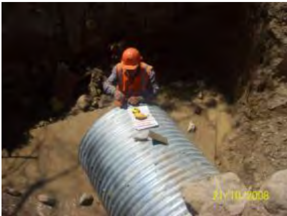
Foto 3.17 Caja de captación de alcantarilla