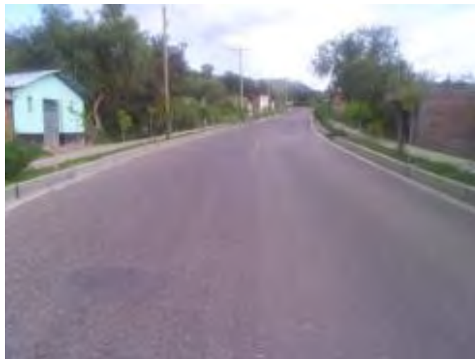
Foto 1.2 Inicio del tramo Asfaltado. Salida desde Huanta hacia Huamanga (Ayacucho).

Las fotos 1.3, 1.4 muestran daños antes mencionados.