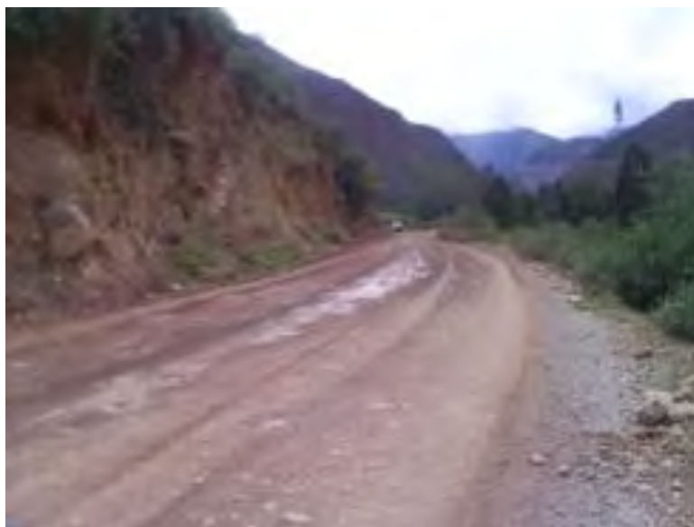
Foto 1.5 Muestra el inicio del tramo afirmado Izcuchaca (Huanta).

A partir de este tramo, la carretera se encuentra no pavimentada, teniendo una superficie de rodadura a nivel de afirmado. La calzada tiene un solo carril, y se tiene una plataforma de un ancho útil que varía de 3.10 m. a 7.20 m.