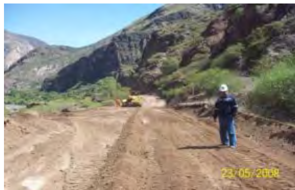
Foto 3.11 Supervisando los trabajos

Luego con apoyo de un equipo de compactación se logra la densidad requerida como se aprecia en la foto 3.12 con ayuda de un rodillo.