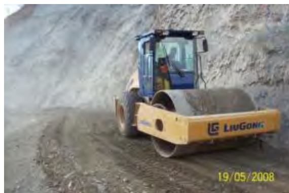
Foto 3.12 Compactación de material

Luego con apoyo de un equipo de compactación se logra la densidad requerida como se aprecia en la foto 3.12 con ayuda de un rodillo.