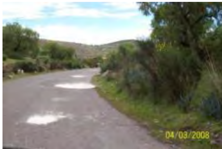
Foto 1.4 Se aprecia las fisuras longitudinales en la vía asfaltada