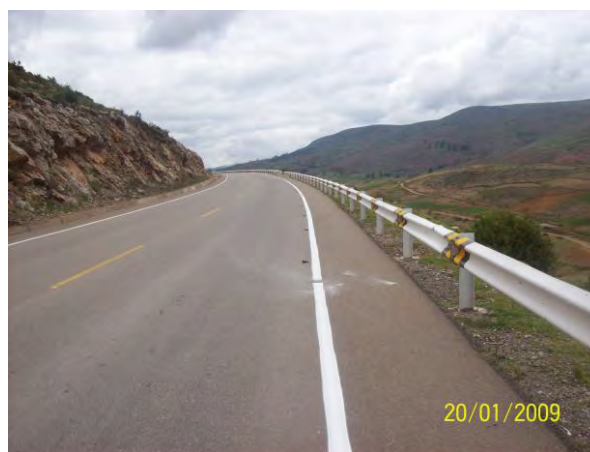
Foto 2.27 Marcas en pavimento

La foto 2.27 muestra los trabajos de marcas en el Pavimento de las líneas de borde.